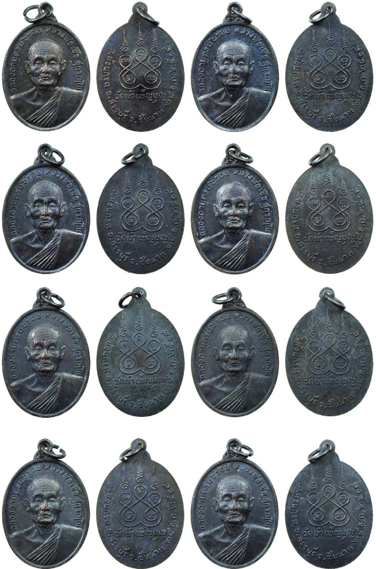
หลวงพ่อบุญตรง สุกกวีณโน