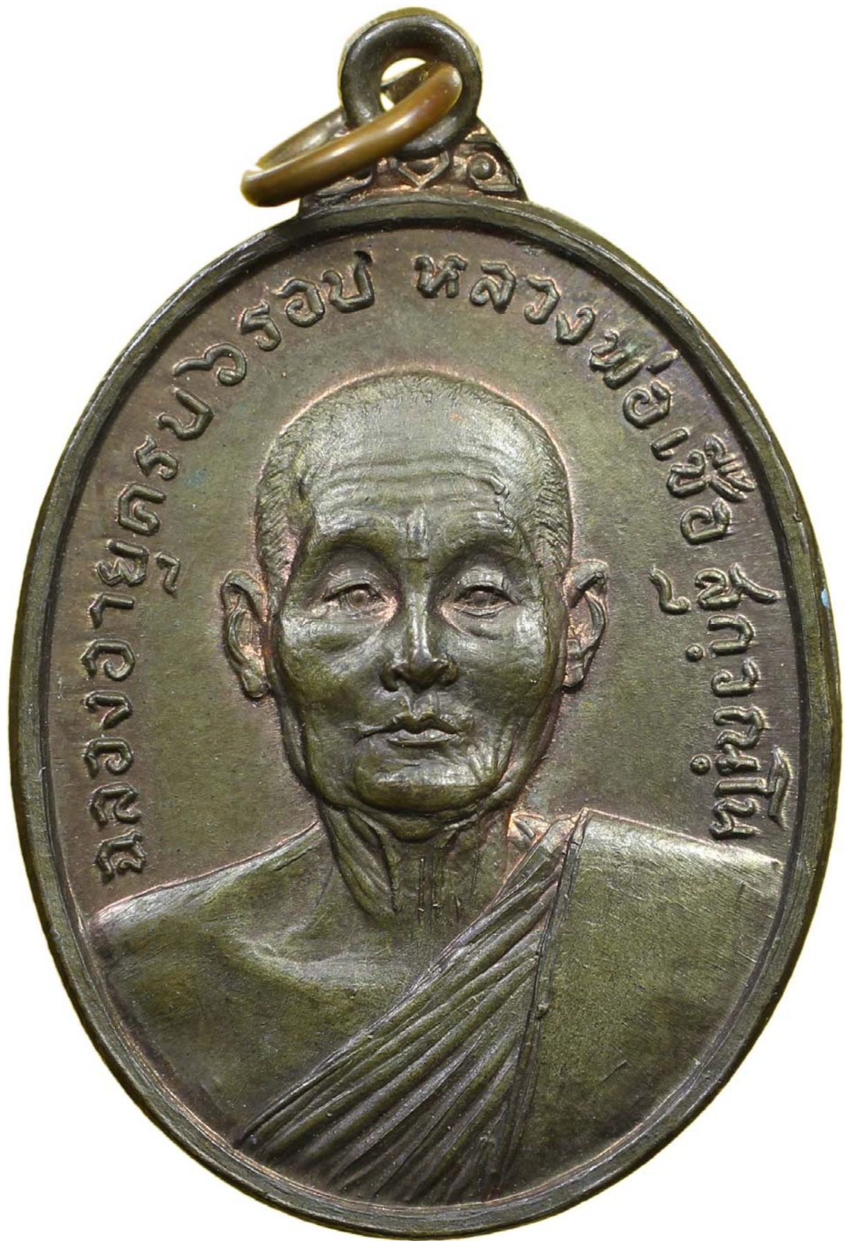
เหรียญหกรอบ หลวงพ่อเชื้อ ปี พ.ศ.๒๕๑๘ เนื้อโลหะ