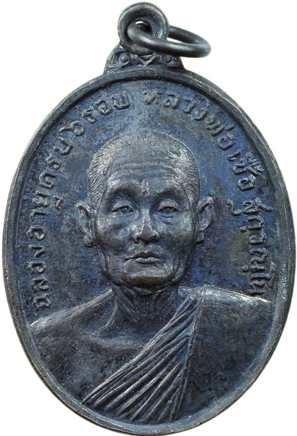
เหรียญครอบ หลวงพ่อเชื้อ ปี พ.ศ.๒๕๑๘ เนื้อทองแดงรมดำ