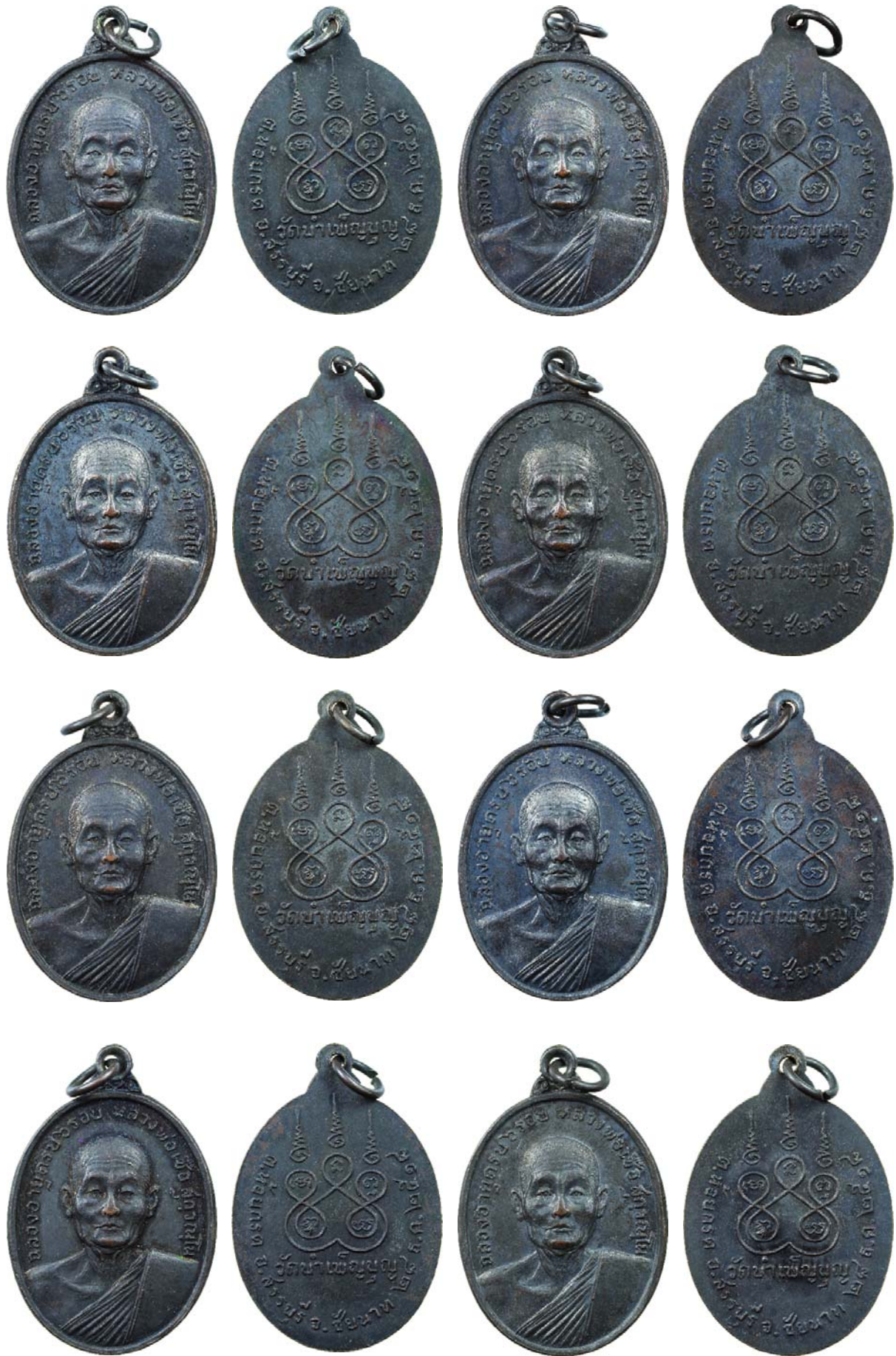
หลวงพ่อเชื้อ สุกกวันโณ