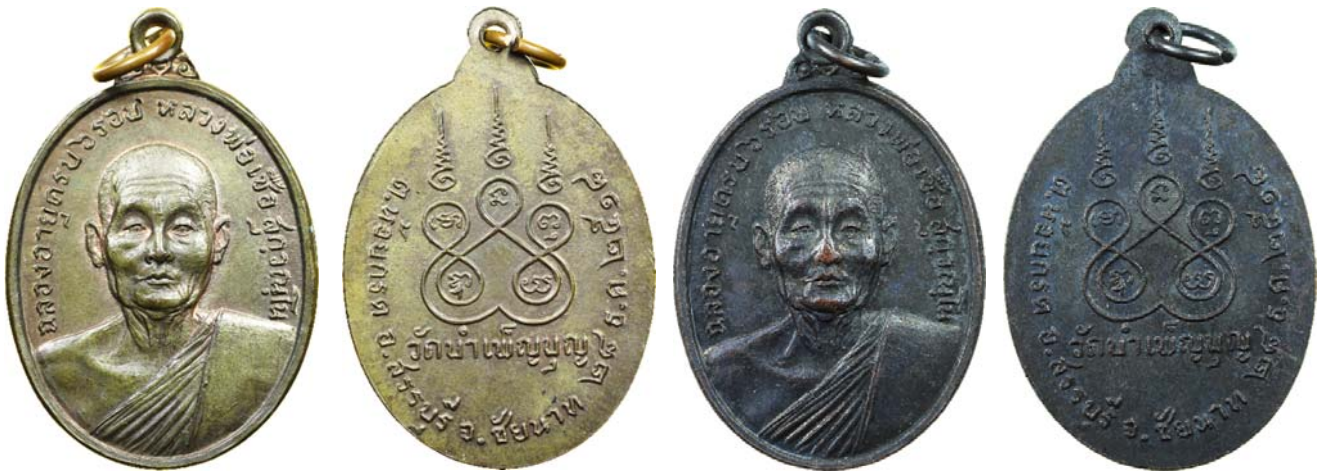
เหรียญหกรอบ เนื้อนวะโลหะ