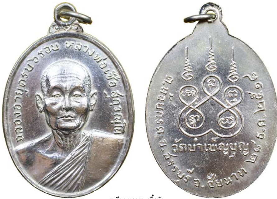
เหรียญหกรอบ เนื้อเงิน