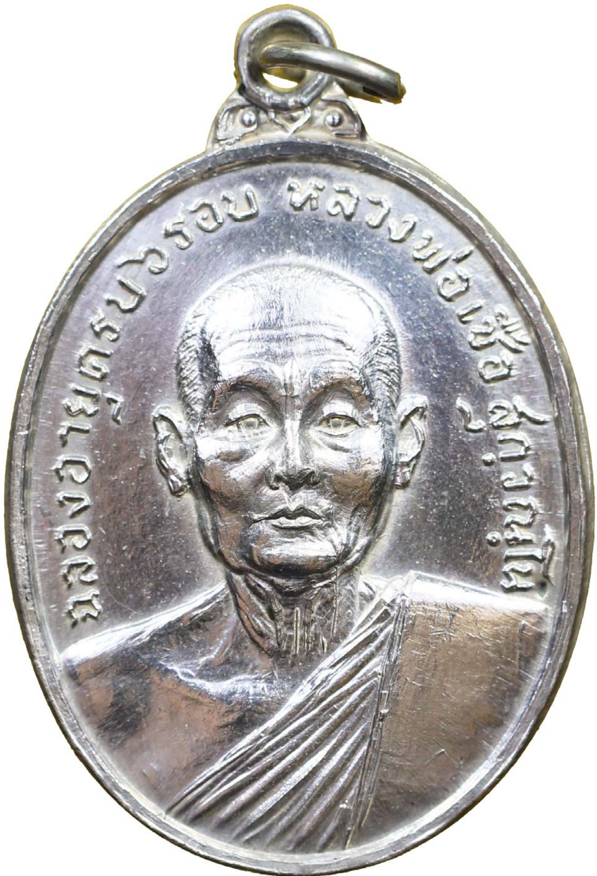
เหรียญหลวงปู่ชาญตรบ หลวงพ่อเชื้อ ปี พ.ศ.๒๕๑๘ เนื้อเงิน