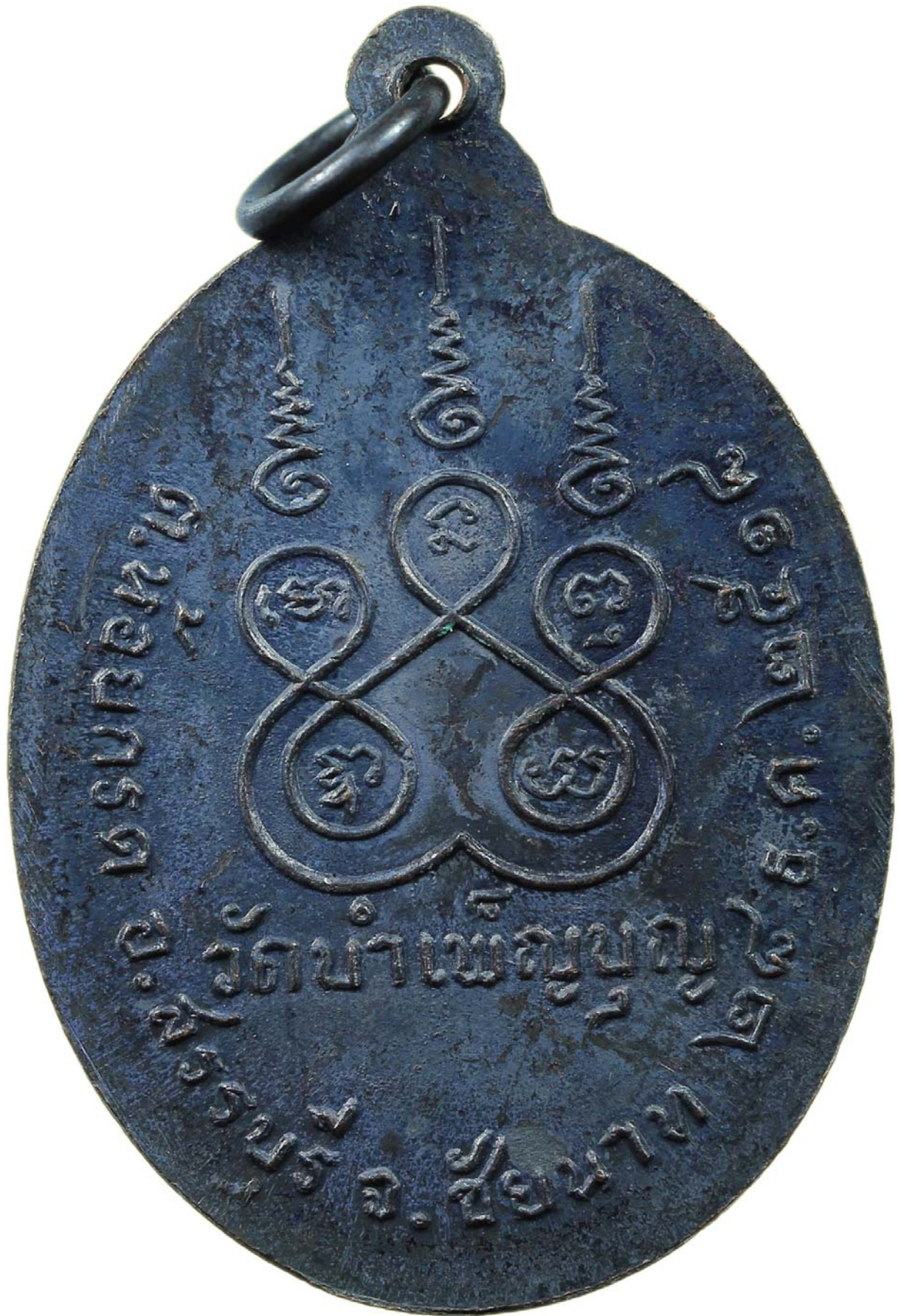
เหรียญครอบ หลวงพ่อเชื้อ ปี พ.ศ.๒๕๑๘ เนื้อทองแดงรมดำ