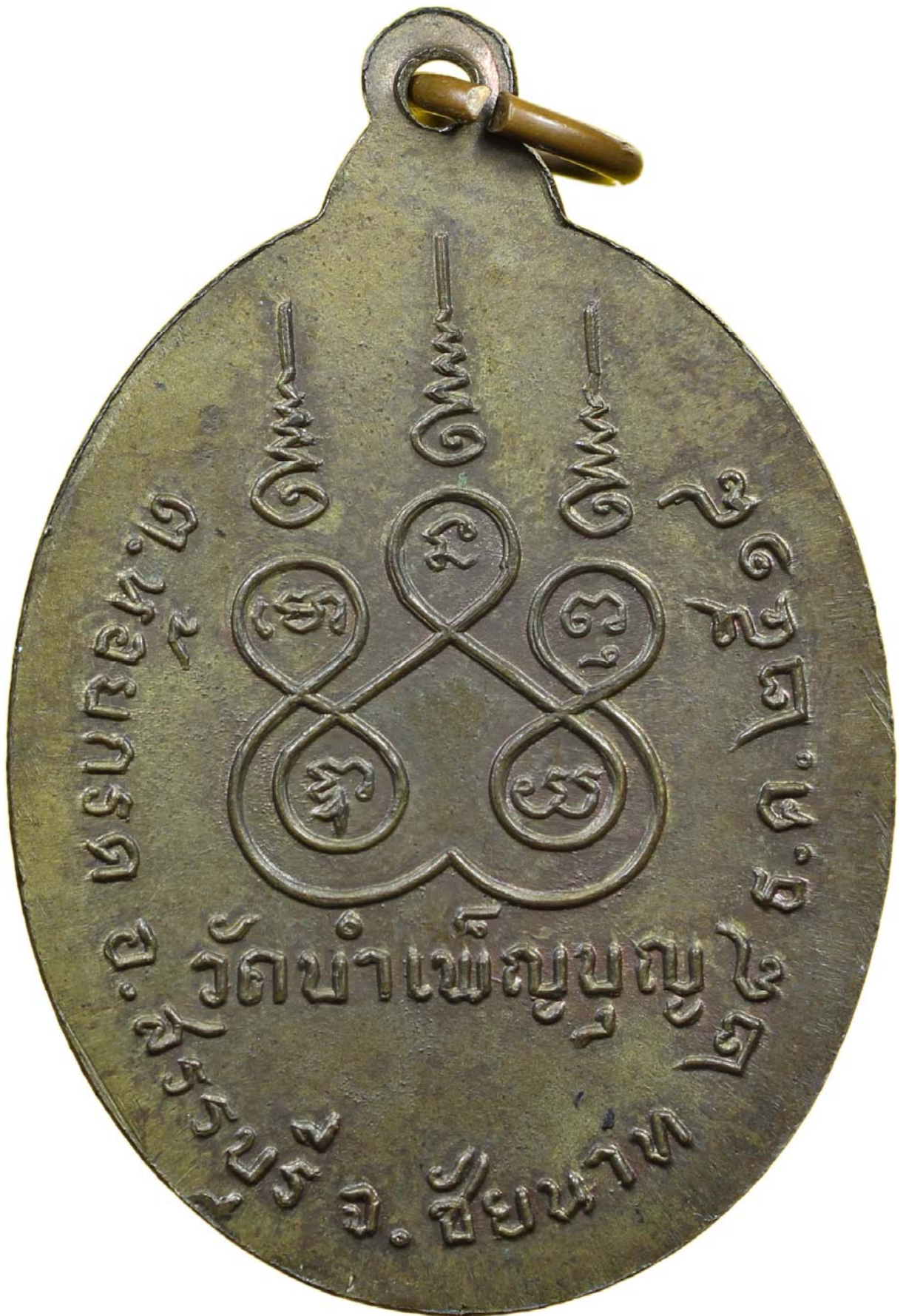
เหรียญหกรอบ หลวงพ่อเชื้อ ปี พ.ศ.๒๕๑๘ เนื้อนวะโลหะ