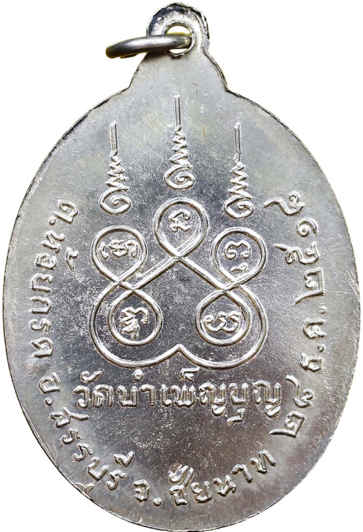
เหรียญหกรอบ หลวงพ่อเชื้อ ปี พ.ศ.๒๕๑๘ เนื้อเงิน